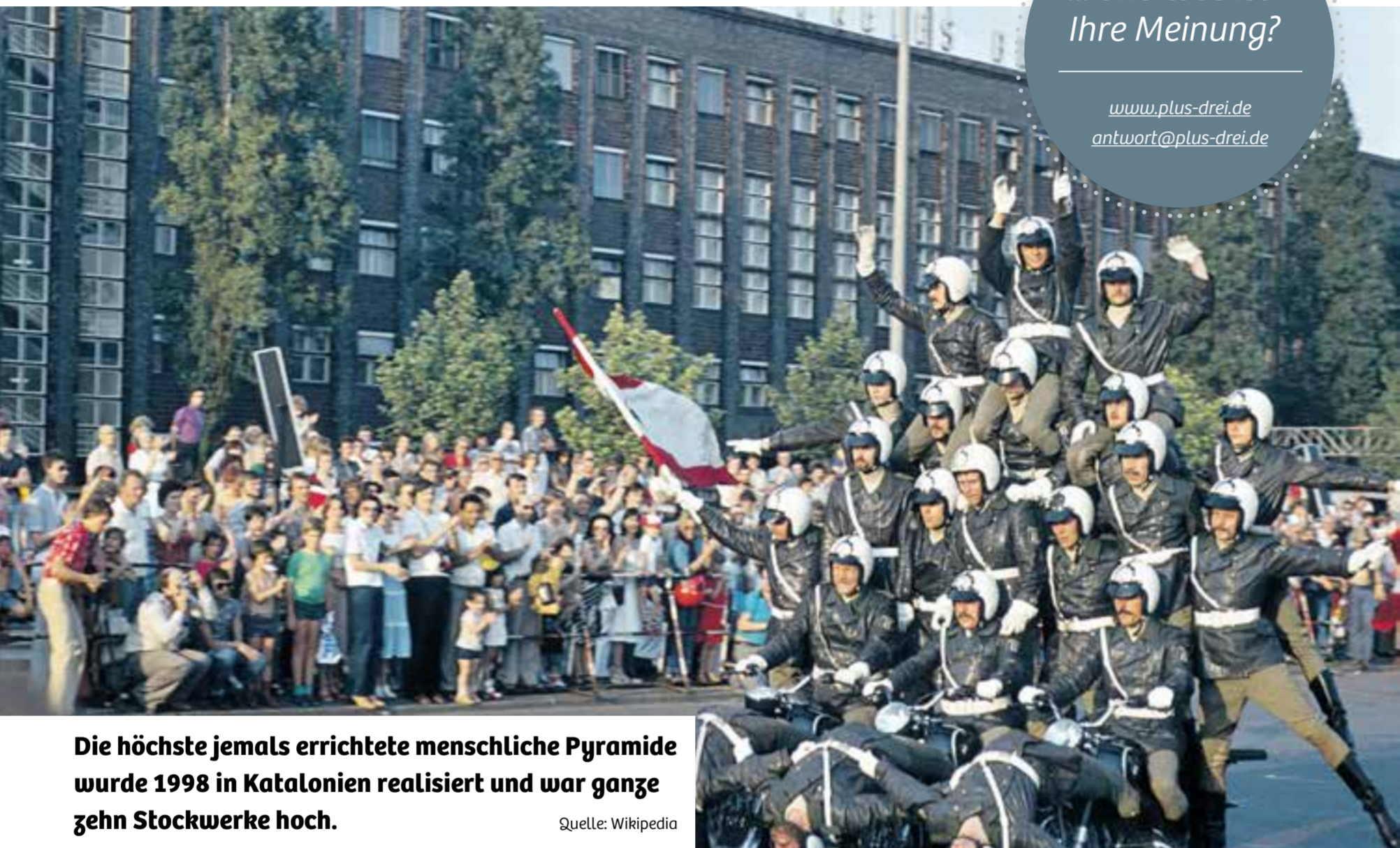
Die höchste jemals errichtete menschliche Pyramide wurde 1998 in Katalonien realisiert und war ganze zehn Stockwerke hoch.