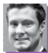
Marcell Jansen, Unternehmer und ehemaliger Profifußballer

irgendwie schien da nie etwas so Spannendes, Wichtiges oder Erreichbares dabei zu sein, für das es sich gelohnt hätte, voll und ganz einzusteigen. Also bin ich meiner Nase gefolgt und habe das gemacht, worauf ich Lust hatte. Das Interesse hat zwar meist nicht lange angehalten und ich bin weitergezogen, aber wenn man etwas mit Achtsamkeit und Hingabe tut, fügen sich die Dinge auch irgendwie zusammen. Mein Hobbys Reisen und Menschen – von Talent kann man da ja nicht reden – sind inzwischen mein Beruf. Ich bin Berater für ein weltweit tätiges Unternehmen in der Entwicklungszusammenarbeit. Meine Antwort wäre also: dahin, wo es dich trägt. Nur nicht zu viel darüber nachdenken, was man später mal machen oder sein will, sondern akzeptieren, dass man in dieser schnelllebigen Welt darauf sowieso nur einen kleinen Einfluss hat.