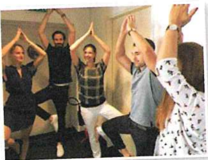
Bewegungsparcours: Die Mitarbeiter von Edenred trainieren gemeinsam Übungen wie hier den klassischen Yoga-Baum.

So kommen die Mitarbeiter auch in der Arbeit schrittweise zu mehr Bewegung, besserer Ernährung und einem wachsenden Bewusstsein für einen gesunden Lebensstil. „Wir verbringen so viel Zeit in der Arbeit und bewegen uns viel zu wenig. Dem möchten wir mit dem um GESUNDHEIT | BEWEGT erweiterten health@work-Programm entgegenwirken. Wir wollen unsere Mitarbeiter dabei unterstützen, gesund zu bleiben, – indem wir sie auf spielerische Art und Weise zu Planern und Machern ihrer Gesundheit machen“, so Mühlbauer. ◀