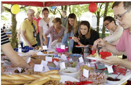
Picknick der Vielfalt am Standort München

Bereits zum dritten Mal in Folge veranstaltete Edenred Deutschland ein „Picknick der Vielfalt“, bei dem Mitarbeiter Spezialitäten aus ihrer Region beziehungsweise ihrem Herkunftsland mitbringen. Die Vielfalt, die im Unternehmen herrscht, ist dabei mit allen Sinnen wahrzunehmen: die unterschiedlichsten Sprachen sind zu hören, und die verschiedensten Farben, Gerüche und schließlich auch Geschmacksrichtungen sind bei dem Picknick wahrnehmbar. Auf diesem Wege macht Edenred die Vielfalt im Unternehmen erlebbar und setzt sich aktiv für sie ein.